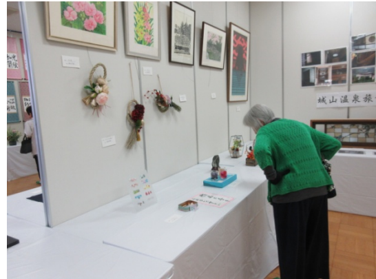
工芸等 巧みさに釘付け