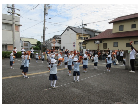
鼓笛演奏は 今ではひばりの代名詞