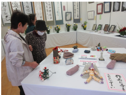
細工物 只々 感心しながら