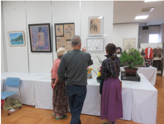
絵画等 解説を聞きながら