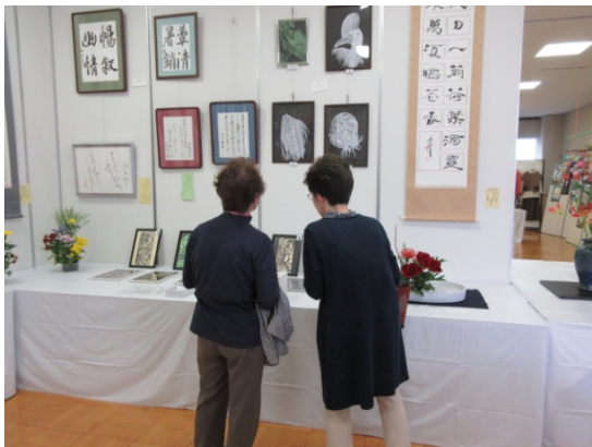
切り絵等 細かいわね