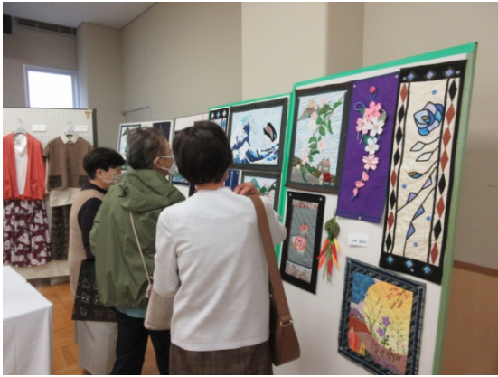
手芸・縫製 繊細な作品