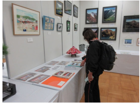
写真等 思い出に弾む