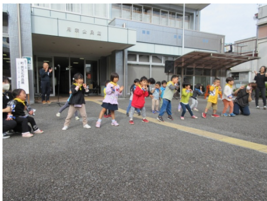
用宗こども園園児は元気いっぱい